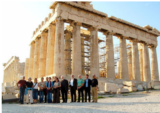
Από την 1 η συνάντηση του PIPELINE στην Αθήνα, Νοέμβριος 2005

Αγαπητέ αναγνώστη, αυτό που κρατάς στα χέρια σου ή πιθανόν να διαβάζεις στο Διαδίκτυο είναι η πρώτη έκδοση του ενημερωτικού δελτίου για τις δραστηριότητες του ευρωπαϊκού προγράμματος PIPELINE – ένα τριμηνιαίο δελτίο από τους καθηγητές και μαθητές που ασχολούνται με την εκπαίδευση στις φυλακές. Διάβασέ το ώστε να πληροφορηθείς για τις εξελίξεις στο συγκεκριμένο τομέα και να γνωρίσεις συναδέλφους (καθηγητές και μαθητές) από την Ευρώπη.